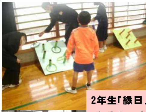
2年生「縁日」伊是名小 1年生との交流学习