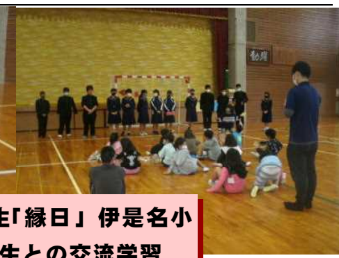
2年生「縁日」伊是名小 2年生との交流学习