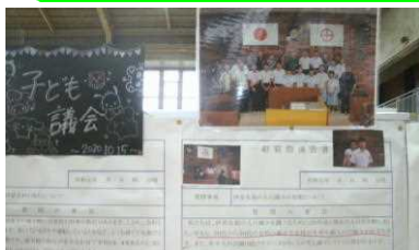
3年生「子ども議会」 質疑・応答内容