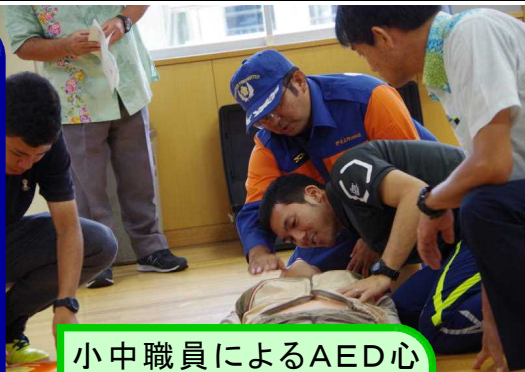
小中職員によるAED心肺蘇生法の体験・訓練

★AED心肺蘇生法講習会に参加された伊是名幼小中の職員のみなさん、講師の伊是名消防団のみなさんお疲れ様でした。★二番通報から救急車が現場に到着する時間は、全国平均で8分、救急車が病院に到着する時間は、およそ40分となっております。伊是名村だとうででしょうか。救急車の到着、診療所または、ヘリでの搬送を考えると、いかにAED心肺蘇生法の実施が必要であるか身にしみて感じているところであり、一年一回は、AED心肺蘇生法講習会で訓練・確認をしましょう。